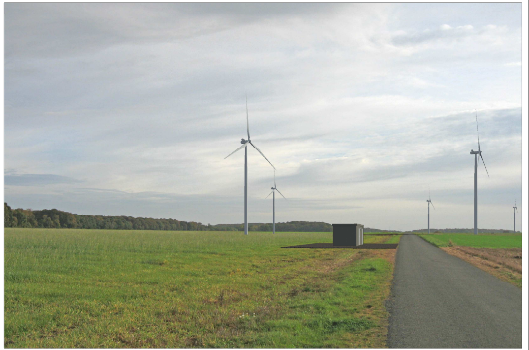
Poste de livraison n°1 : Vue après implantation