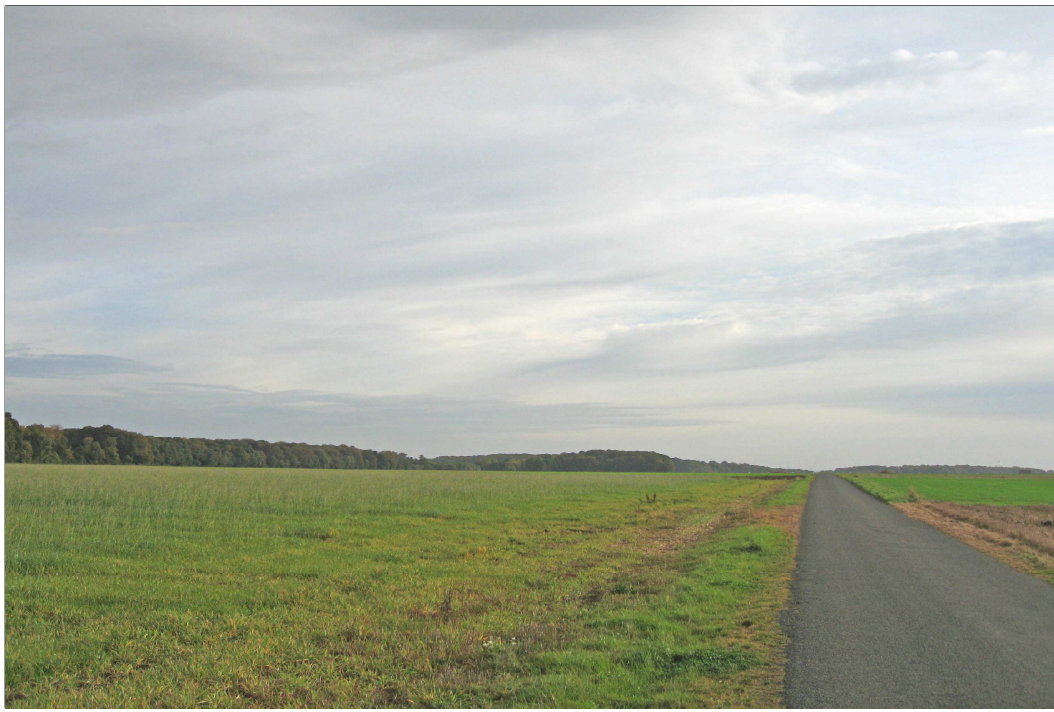
Poste de livraison n°1 : Vue avant implantation